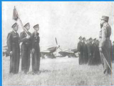
По пути во Францию. Прибытие полка «Нормандия-Неман» на аэродром Штутгарт

Le 5 juin, avant le départ d'URSS, les pilotes du régiment et les représentants de l'Ambassade de France et de la Mission Militaire Française ont assisté à la cathédrale catholique St Louis à Moscou à la messe commémorative en mémoire des pilotes français défunts. Ils ont aussi visité le cimetière Vvedenskoye et ont déposé les fleurs sur les tombes des pilotes français et des mécaniciens soviétiques. L'exploit des pilotes français à été hautement apprécié par le commandement soviétique. «Quant à la France, l'importance de la lutte du régiment «Normandie-Niemen» est formulée par Charles de Gaulle: «En rendant le dernier soupir, vous avez dit: «Vive la France!» Eh bien, dormez en paix! La France vivra parce que vous avez su mourir pour elle...» Par deux ordres édictés par le Présidium du Conseil Suprême de l'URSS le régiment a été décoré de l'Ordre du Drapeau Rouge et de l'Ordre Alexandre Newsky et par dix autres des décorations militaires ont été décernées aux pilotes français, dont quatre ont été élevés à la dignité de Héros de l'Union Soviétique. Selon la directive du Commandant en chef pour témoigner l'amitié entre le peuple français et le peuple