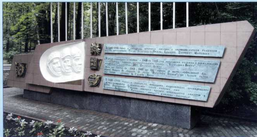
Hôpital militaire de l'Aviation à Sokolniki, fondés dans les années de la Seconde Guerre mondiale.