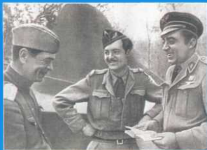
Французские летчики «Нормандия» в часы досуга беседуют с советским летчиком