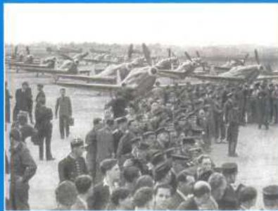
Прибытие во Францию. Самолеты Як-3 полка «Нормандия-Неман» на парижском аэродроме Бурже

1. En revenant en France, l'arrivée du régiment «Normandie-Niemen» au terrain d'aviation de Stuttgart