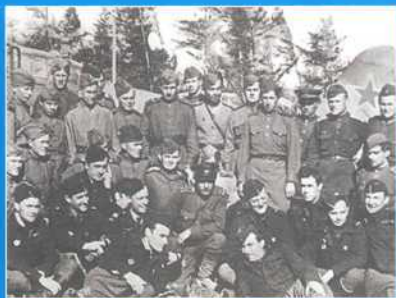
Советские и французские пилоты

Escadrille «Normandie» avant le départ en Union Soviétique (la base aérienne de Rayak au Liban), fin 1942