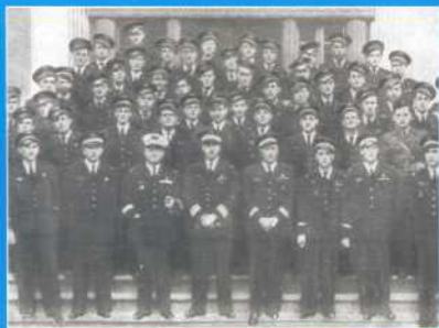
Эскадрилья «Нормандия» перед отправкой в Советский Союз (авиационная база Раяк в Ливане). Конец 1942 г.

De la part du Commandement de la France Combattante (Petit)